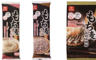
もち麦うどん もち麦そば もち麦お好み焼粉