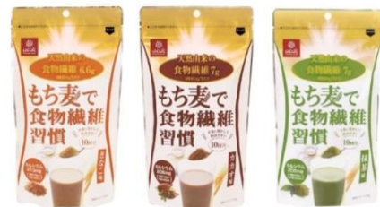
もち麦で食物繊維習慣 きなこ味/カカオ味/抹茶味