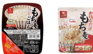
もち麦ごはん 無菌パック かけるだけもち麦