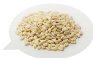
「もち麦」で #ちよい足し食物繊維