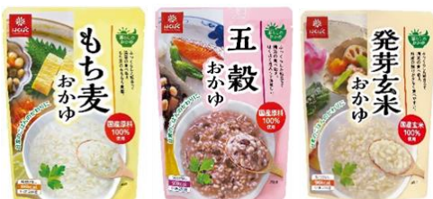
もち麦おかゆ/五穀おかゆ/発芽玄米おかゆ