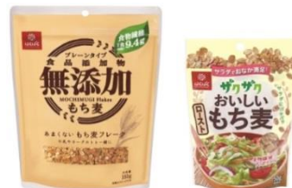
あまくないもち麦フレーク ザクザクおいしい ローストもち麦