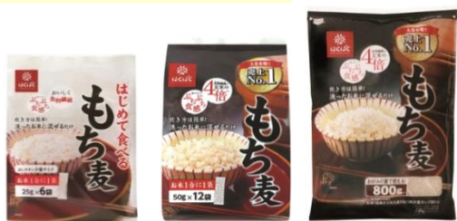
はじめて食べるもち麦 もち麦 スタンドパック もち麦 800g