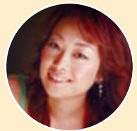
菅 純子 (ソプラノ歌手)